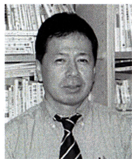
憲法県政の会・代表幹事