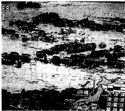
人も家屋もすべてを飲みこむ津波の恐ろしさに驚く