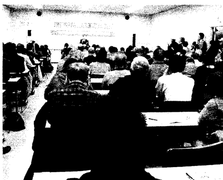
「核兵器全面禁止」の署名運動を提起した集会

被災地支援に取り組みました。今後、情報収集とともに次のとおり救援活動に取り組まします。