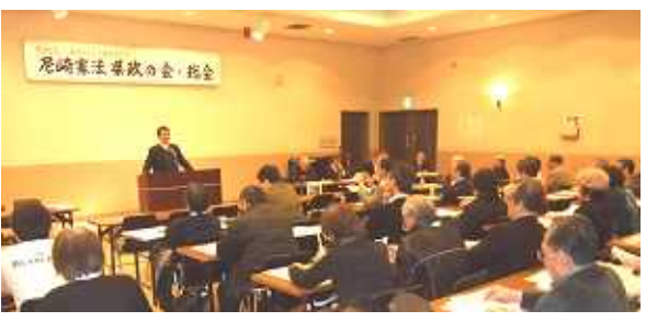
4/16 尼崎の会 総会